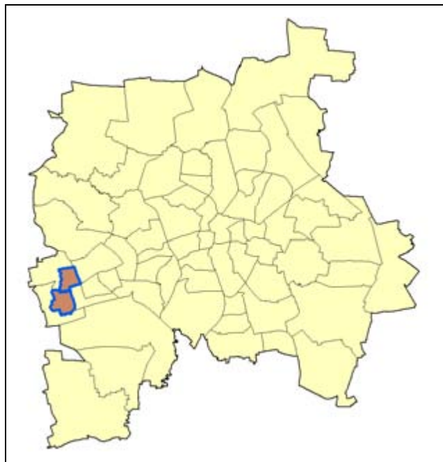
Lage des Sanierungsgebiets in der Stadt

Das Sanierungsgebiet wird im vereinfachten Verfahren statt im klassischen Verfahren durchgeführt. Ausgleichsbeiträge werden daher nicht erhoben.