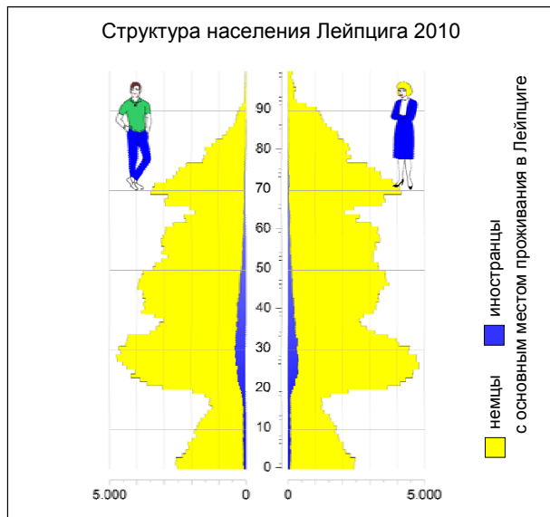
Структура населения Лейпцига 2010

Жители с основным местом проживания (31.12.2010) . 522 883 из них: мужчин ..... 253 533 женщин ..... 269 350 из них: немцев ..... 492 686 иностранцев ..... 30 197 из них: русских..... 9,1 % украинцев..... 9,1 % вьетнамцев..... 8,6 % из них: менее 6 лет ..... 5,4 % 6 до менее 15 лет ..... 6,0 % 15 до менее 65 лет ..... 66,2 % 65 лет и старше ..... 22,4 %