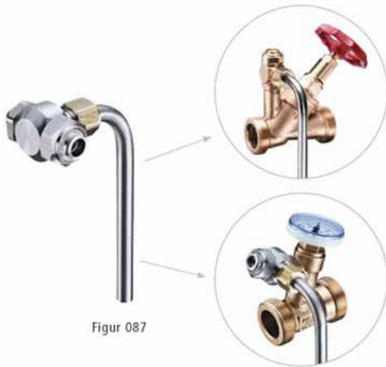
Abbildung: Beispiele für Probenahmehähne