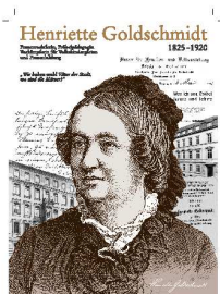
Postkarte der Louise-Otto-Peters-Gesellschaft e.V.