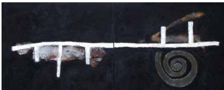
Karthago heute von Gil Schlesinger - Mischtechnik auf Leinwand, 1990