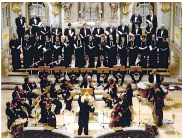
Leipziger Synagogalchor, 2006, Konzert in der Dresdner Frauenkirche