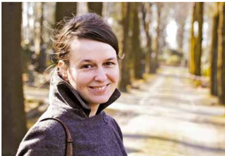
Regisseurin: Britta Wauer