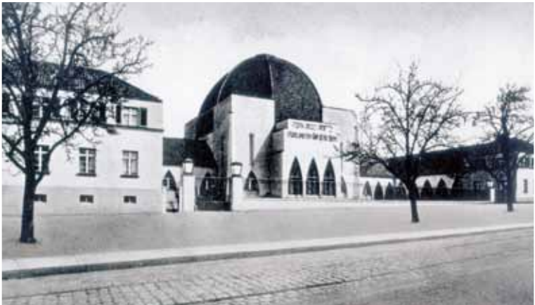
Friedhofsbau von Wilhelm Haller, um 1928, zerstört 1938/39

Veranstalter: Leipzig Details, Mitglied im Forum Neue Städtetouren – dem StattReisen-Verband