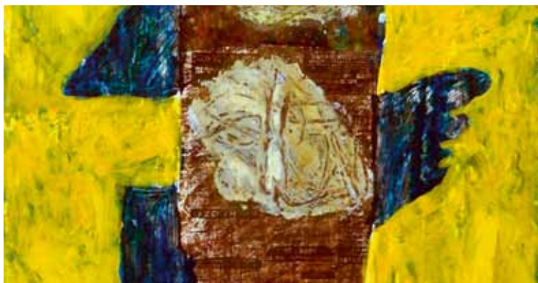
Die drei Gesandten von Gershon Rennert - Ausschnitt