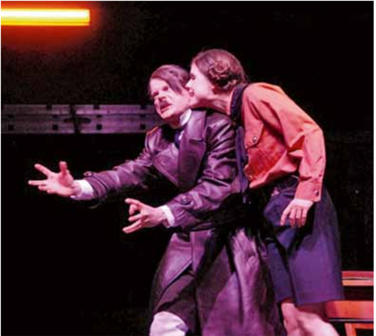
Szenen aus MEIN KAMPF