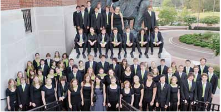
Jugendsinfonieorchester Musikschule Leipzig „Johann Sebastian Bach“