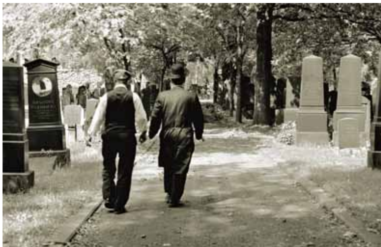
Der Alte Israelitische Friedhof