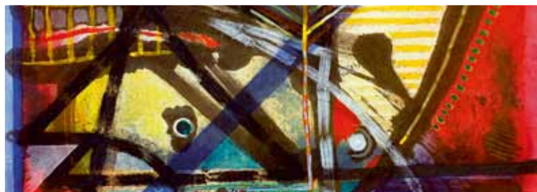
Jungvogels Tagtraumflug von Günther Huniat - Ausschnitt