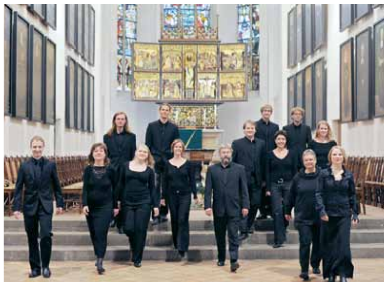
Kammerchor Josquin des Préz