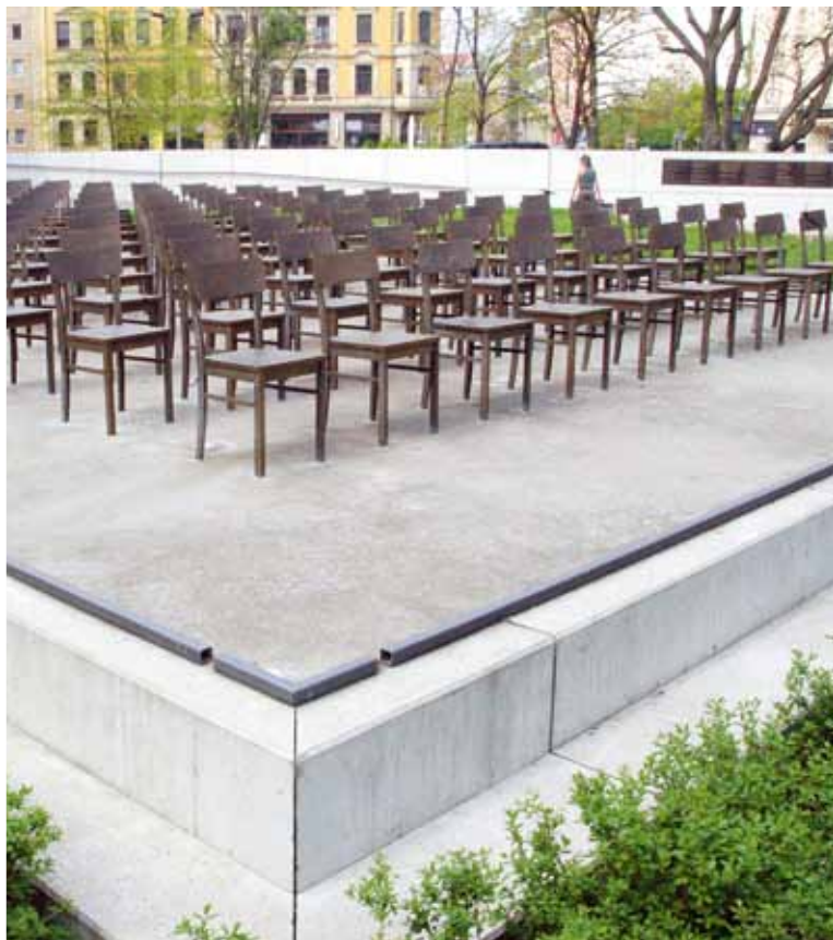
Gedenkstätte am Ort der ehemaligen Großen Synagoge Gottschedstraße / Ecke Zentralstraße