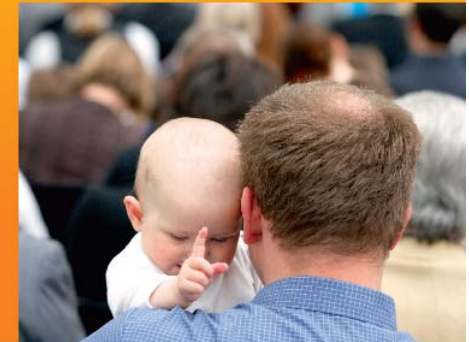
Leipziger Handbuch für Familien

Die Koordinierungsstelle „Regionales Übergangemanagement Leipzig“ wird von 2006 bis 2012 im Programm „Perspektive Berufsabschluss“ aus Mitteln des Bundesministeriums für Bildung und Forschung und aus dem Europäischen Sozialfonds der Europäischen Union gefördert.