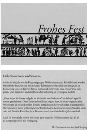
Weihnachtskarte Dezember 2004

Vor dem Hintergrund einer stärkeren öffentlichen Präsenz der Arbeit des Seniorenbeirates und einer möglichst direkten Ansprache der älteren alleinlebenden Bürger der Stadt Leipzig hat der Arbeitskreis die Postkartenaktion „Weihnachts- und Neujahrsgrüße“ für die ältere Ge-