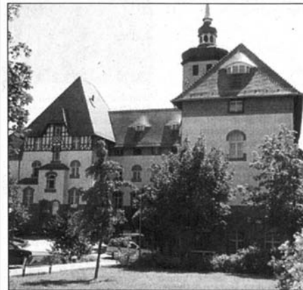
Wohnen in den eigenen vier Wänden muss im Alter nicht zum Problem werden. Auch Leipzig bietet Betreutes und Servicewohnen in insgesamt 42 dafür vorgesehenen Wohnanlagen an.

mit ihrer Lage, Ausstattung und Größe beschrieben. Weiterhin sind Angaben zu Mithöhe, Nebenkosten und Betreuungsleistungen zu finden. Damit wird eine gewisse Vergleichbarkeit hergestellt. Dennoch differieren die einzelnen Wohnanlagen erheblich voneinander. Deshalb empfiehlt sich der Besuch in den favorisierten Wohnanlagen und das Gespräch mit den jeweiligen Ansprechpartnern. Namen und Telefonnummern von Ansprechpartnern, Vermietern und Betreuungsträgern ergänzen den Porträtteil der Broschüre. Ausführlich wird auch auf die Betreuung eingegangen, die in den einzelnen Anlagen sehr unterschiedlich ausgeprägt ist. Sie ist in der Regel mit Pauschalen finanziert werden und in kostenpflichtige Zusatzleistung gegliedert. Eine kleine praktische Checkliste mit wichtigen Auswahlkriterien ergänzt die Einführung. Die Broschüre ist kostenlos in der Wohnberatungsstelle des Sozialamtes, Burgplatz 1, und im Referat Beauftragte in der Friedrich-Ebert-Straße 19 a, erhältlich. ■