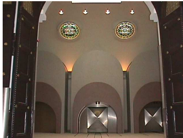
Ansicht auf Einäscherungsöfen