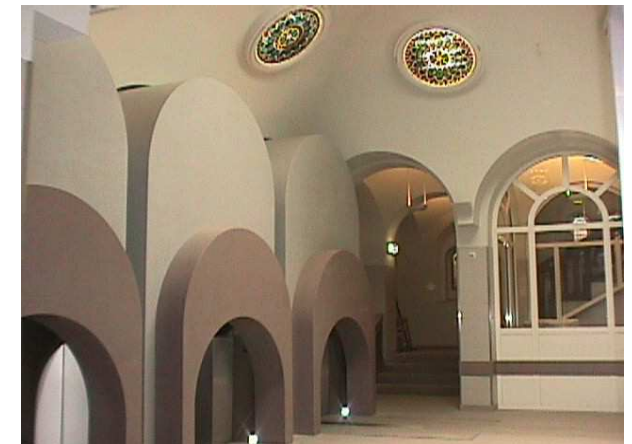
Seitenansicht der Einäscherungshalle

Im Jahr 1998 begann die Rekonstruktion des alten Krematoriums. Bei der Gestaltung der Einäscherungshalle achtete man darauf, dass die ehemalige Gestaltung vom Stadtbaurat Scharenberg zum sakralen Charakter dieses Raumes wieder umgesetzt wird.