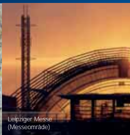
Leipziger Messe (Messeområde)