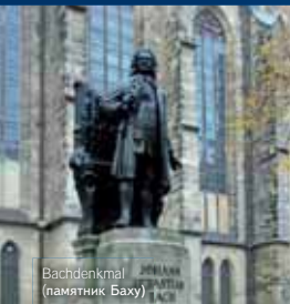
Bachdenkmal (памятник Баху)

* Данное предложение действительно при наличии путевок. Заявки принимаются не позднее 4 недель до приезда. Возможны индивидуальные решения для срочных путевок.