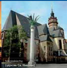
Nikolaikirche (церковь Св. Николая)