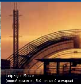
Leipziger Messe (новый комплекс Лейпцигской ярмарки)