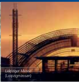
Leipziger Messe (Leipzigmässan)