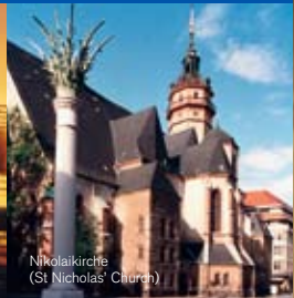
Nikolaikirche (St Nicholas' Church)