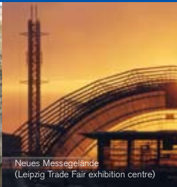
Neues Messegelände (Leipzig Trade Fair exhibition centre)