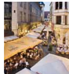
La ruelle Barfußgäßchen regorge de bars et de cafés

Les musiciens ne furent pas les seuls attirés par Leipzig ; on compte aussi bon nombre de poètes, philosophes et artistes amateurs. Aujourd'hui encore, la ville se caractérise par sa diversité culturelle remarquable, sans égale : colorée, créative et regorgeant d'idées novatrices à découvrir lors de concerts en plein air, dans les galeries de la filature (ancienne usine de filature de coton) ou encore dans les bars branchés qui n'ont pas d'heure de fermeture. Les adeptes de shopping y trouveront eux aussi chaussures à leur pied. Rien de tel qu'une longue balade à travers les passages magnifiquement restaurés, les petits commerces spécialisés et les grands magasins. Ne manquez pas non plus d'admirer les trésors architecturaux de la ville. Ouvrez grand vos yeux !