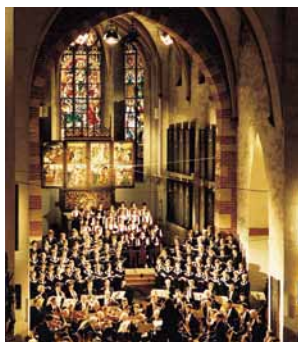
L'Orchestre du Gewandhaus de Leipzig et le Chœur de Saint-Thomas dans l'église Saint-Thomas

La musique est la seule forme d'art à pouvoir bouleverser et animer l'homme au plus profond de son être. À Leipzig, la force qui en émane est sensible en tout lieu : dans les rues et sur les places, dans les salles de concert et dans les nombreux lieux d'activité des célèbres compositeurs et musiciens. Car au cours des siècles passés, de grands noms de l'histoire musicale y ont vécu et travaillé: le cantor de l'église Saint-Thomas Jean-Sébastien Bach, le chef de l'Orchestre du Gewandhaus Felix Mendelssohn Bartholdy et le couple Clara et Robert Schumann tout comme Richard Wagner, Edvard Grieg, Albert Lortzing, Gustav