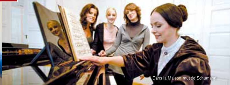
Dans la Maison-musée Schumann