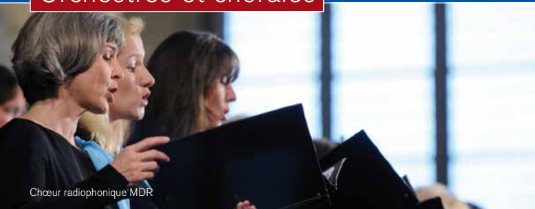
Chœur radiophonique MDR