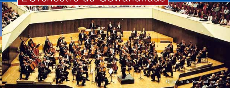
Orchestre du Gewandhaus

La musique est la seule forme d'art à pouvoir bouleverser et animer l'homme au plus profond de son être. À Leipzig, la force qui en émane est sensible en tout lieu : dans les rues et sur les places, dans les salles de concert et dans les nombreux lieux d'activité des célèbres compositeurs et musiciens. Car au cours des siècles passés, de grands noms de l'histoire musicale y ont vécu et travaillé: le cantor de l'église Saint-Thomas Jean-Sébastien Bach, le chef de l'Orchestre du Gewandhaus Felix Mendelssohn Bartholdy et le couple Clara et Robert Schumann tout comme Richard Wagner, Edvard Grieg, Albert Lortzing, Gustav