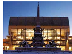
Gewandhaus de Leipzig

En sa qualité de lieu de représentation du fameux Orchestre du Gewandhaus, la salle de concert est l'une des meilleures adresses au monde. Environ un demi-million d'amoureux de la musique du monde entier visitent le Gewandhaus chaque année. En 1743, des commerçants de Leipzig ont ainsi fondé l'orchestre de concert bourgeois le plus ancien d'Europe. La salle inaugurée à la fin du XVIII e siècle dans la maison de commerce des drapiers de l'époque est à l'origine de son nom. Mais ses chefs d'orchestre ont marqué sa réputation légendaire : de Johann Adam Hiller en passant par Felix Mendelssohn Bartholdy et Arthur Nikisch jusqu'à Kurt Masur, Herbert Blomstedt et aujourd'hui Riccardo Chailly.