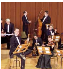
Orchestre de salon Cappuccino

Quand quatre Lipsiens (habitants de Leipzig) mélomanes se rencontrent, ils fondent un quartet à cordes, puis un orchestre. La tradition des formations musicales de la ville est légendaire. L'Orchestre symphonique MDR par exemple compte parmi les plus anciens ensembles radiophoniques au monde. Avec le Chœur radiophonique MDR et le Chœur des enfants, unique en son genre, l'orchestre se produit notamment dans le Gewandhaus et dans les studios MDR sur l'Augustusplatz. Son répertoire comprend aussi bien des œuvres connues que de la musique expérimentale. L'Orchestre de chambre Mendelssohn, l'Orchestre académique de Leipzig, l'Orchestre de l'Université de Leipzig ou l'Orchestre de salon Cappuccino font eux aussi le bonheur des amoureux de la grande musique. La crème de la crème !