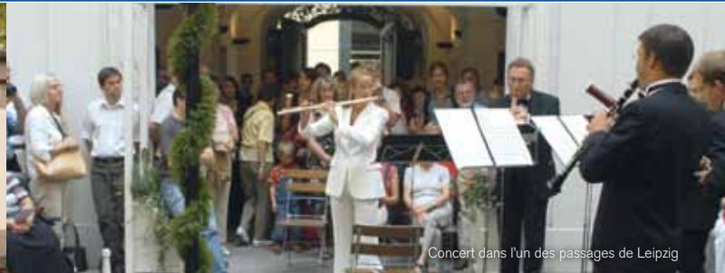
Concert dans l'un des passages de Leipzig