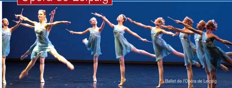
Ballet de l'Opéra de Leipzig