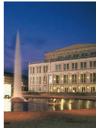
Opéra de Leipzig sur la place Augustusplatz