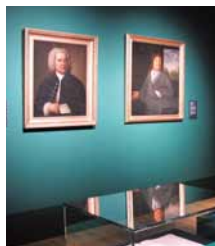
Dans le nouveau Musée Bach

Agrandi et réaménagé, le Musée Bach à Leipzig, situé sur la place Thomaskirchhof, a rouvert ses portes en mars 2010 à l'occasion du 325 ème anniversaire de Bach. La nouvelle exposition permanente invite à découvrir la vie et les œuvres de Bach de diverses manières : expériences acoustiques, espaces multi-média et éléments interactifs y côtoient de précieux originaux. La pièce maîtresse de l'exposition est la Salle du trésor où sont présentés des manuscrits originaux de Bach ainsi que d'autres raretés. Les visiteurs ont également la possibilité, lors de visites guidées et de concerts, d'accéder à la Salle d'été de style baroque avec sa chambre de résonance exceptionnelle. Organisé tous les ans en juin, le Festival Bach (« Bachfest ») est le point culminant du calendrier des manifestations : Le festival international présente environ 100 concerts et spectacles dans de nombreux lieux authentiques, comme l'église Saint-Thomas ou l'ancien Hôtel de Ville.